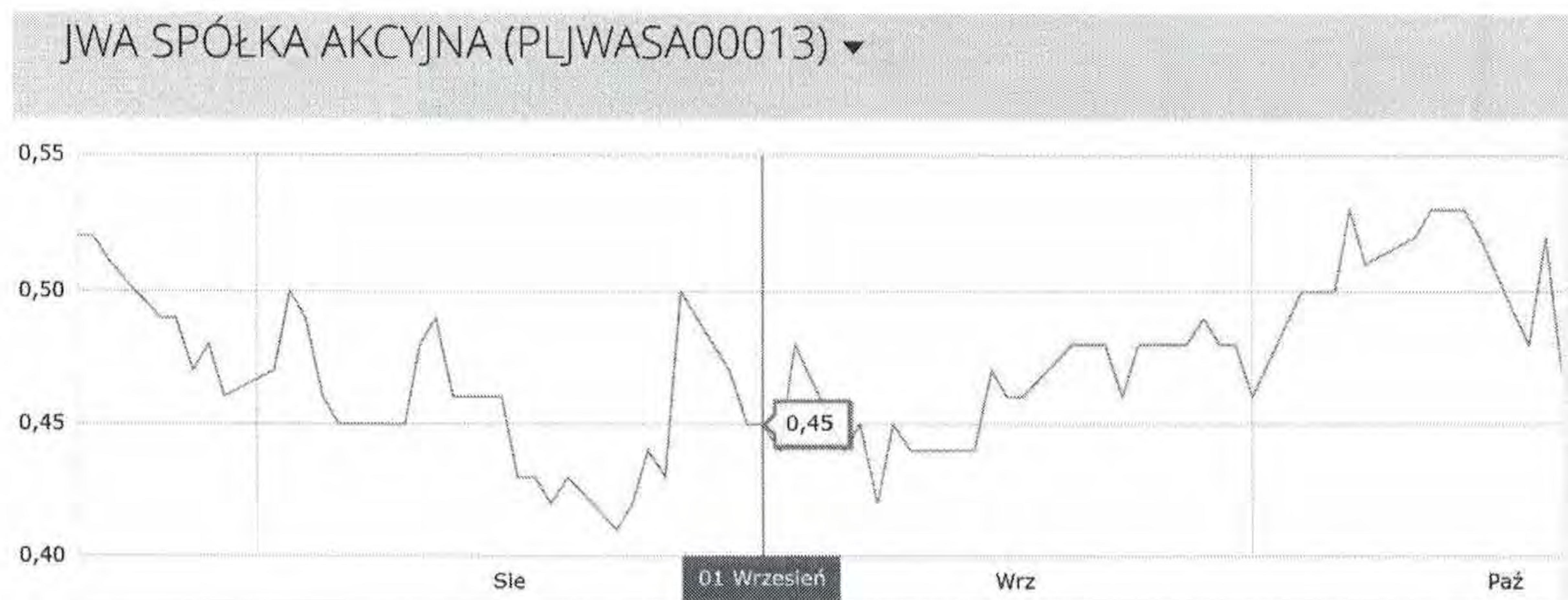
Rysunek 1. Kurs zamknięcia notowań akcji spółki pod firmą JWA S.A.

Na podstawie powyższych informacji dokonano wyceny 100% akcji Spółki zgodnie ze wzorem: